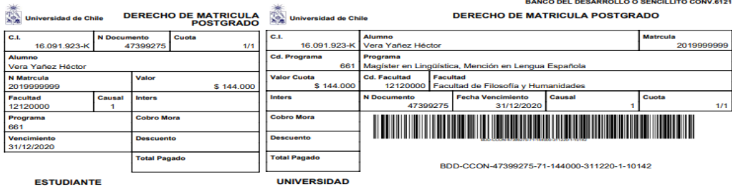
Imagen 8: Cupón de Pago

Es importante que conserve el cupón de pago timbrado para acreditar el pago del derecho de matrícula. Considere que este tipo de pago puede tardar hasta 5 días hábiles en aparecer reflejado en el sistema institucional de matrícula.