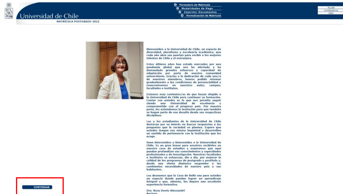
Imagen 2: Página de bienvenida

Al ingresar los datos solicitados, usted será dirigido a la página de bienvenida (imagen 2)